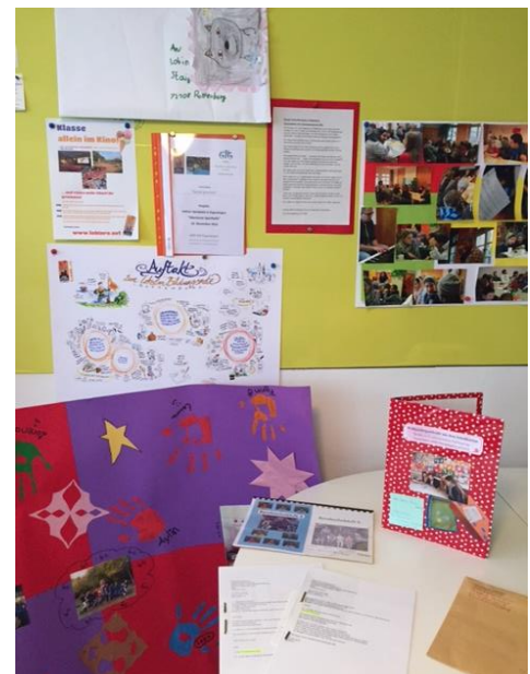
Acht Schulklassen haben eine soziale Aktion durchgeführt und sich damit für einen Preis beworben

In den nächsten Tagen werden daher außerschulische Rottenburger Institutionen angeschrieben, die sich um Jugendbildung in der Stadt verdient machen: Träger und Mitarbeitende der Jugendarbeit und der Jugendsozialarbeit sowie Vereine sollen bei ihrem Nachwuchs für eine Jury-Teilnahme und damit für ein interessantes Lernfeld werben. Jugendliche zwischen 10 und 18 Jahren, die sich gerne in der Preisjury engagieren möchten und nicht mit ihrer Klasse am Wettbewerb teilgenommen haben, können sich auch gerne direkt im LoBiN-Büro melden. Die Jury-Sitzung wird noch terminiert. Sie wird im Workshop-Format abgehalten und etwa zwei Stunden dauern. Den Mitgliedern der Jury winkt zudem ein Überraschungsgeschenk .